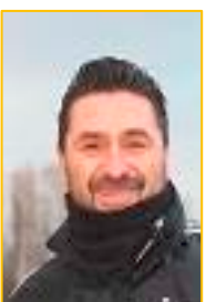
SHOULS Gerland Sportieve ondersteuning Doorstroming Seniors